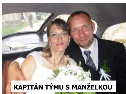
KAPITÁN TÝMU S MANŽELKOU