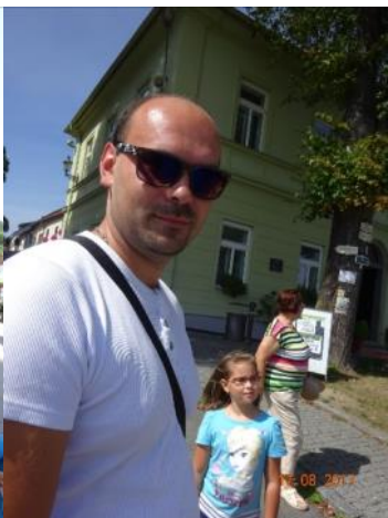
pan Běhal Bystřice pod Hostýnem

a) My jsme zaparkovali dál, tady byla značka, že je plno. b) V žádném případě ne, protože nemám rád lidi, kteří musejí stát až před. Když je to výlet, tak proč by se nemohli lidi taky trochu projít.