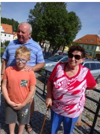
pan Lang Vacov

a) Kapacita je malá. Jsem tady s vnoučatama a kroužíme tady, abychom našli místo. b) Problém by to nebyl, kdyby to nebyl prudký kopec.