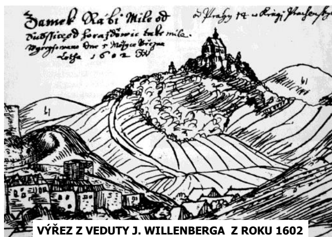
VÝŘEZ Z VEDUTY J. WILLENBERGA Z ROKU 1602