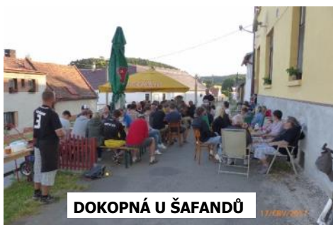
DOKOPNÁ U ŠAFANDŮ