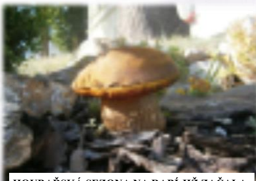
HOUBAŘSKÁ SEZONA NA RABÍ JIŽ ZAČALA