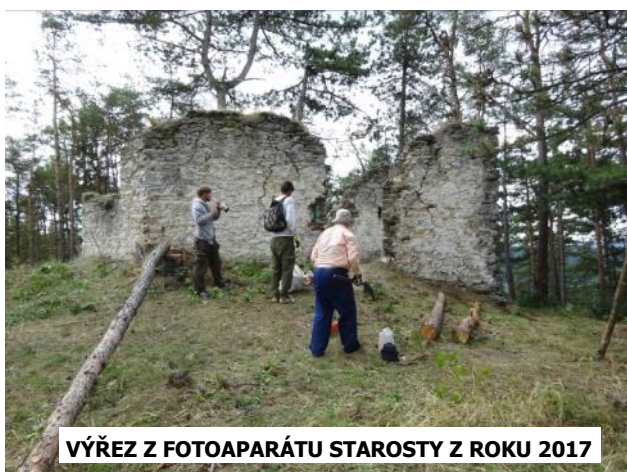
VÝŘEZ Z FOTOAPARÁTU STAROSTY Z ROKU 2017