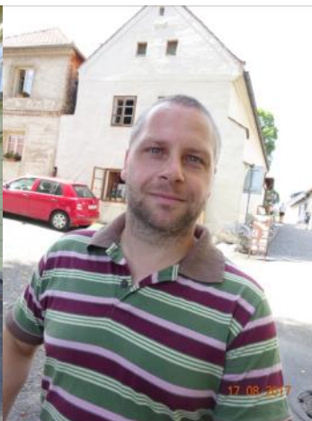
pan Kušál Jihlava

a) Parkování neřeším, zaparkovali jsme to na silnici. b) Pro mě by to problém určitě nebyl.