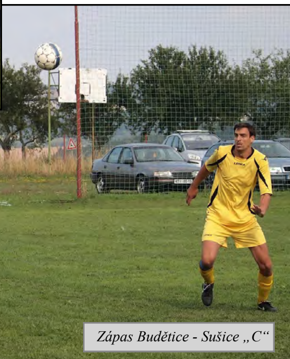
Zápas Budějovice - Sušice „C“