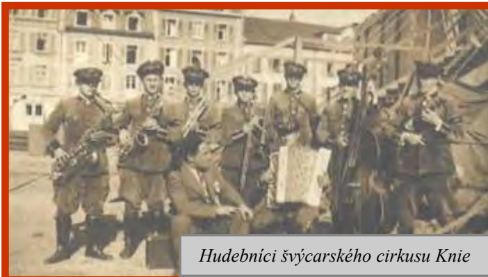
Hudebníci švýcarského cirkusu Knie