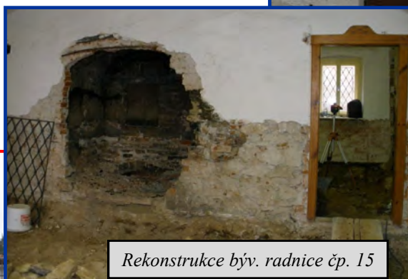
Rekonstrukce býv. radnice čp. 15